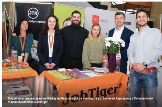
Форумът е организиран от Междуниверситетския център за развитие на кариерата и Студентския съвет съвместно с JobTiger.

откриването на кариерния форум. Той акцентира на символиката на числата, но прикани следващият